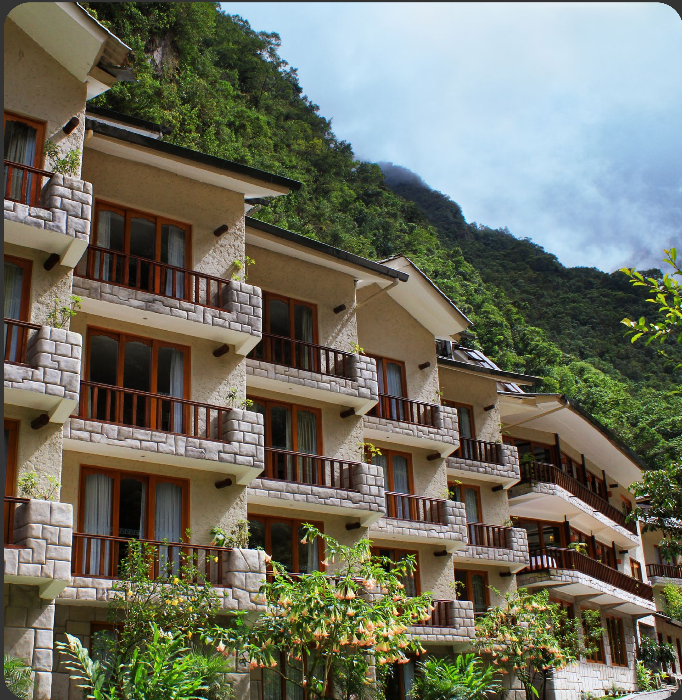
Sumaq Machu Picchu Hotel Luxury Edition. Machu Picchu.