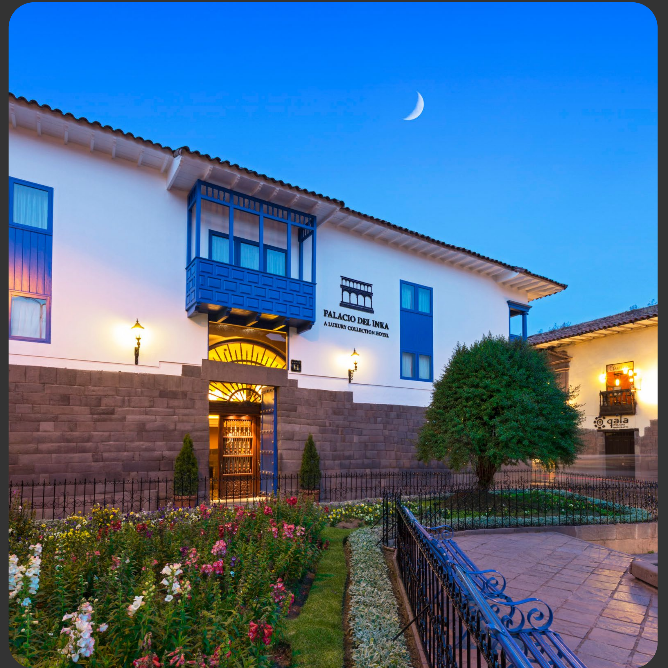
Palacio del Inka, a Luxury Collection Hotel. Cusco.