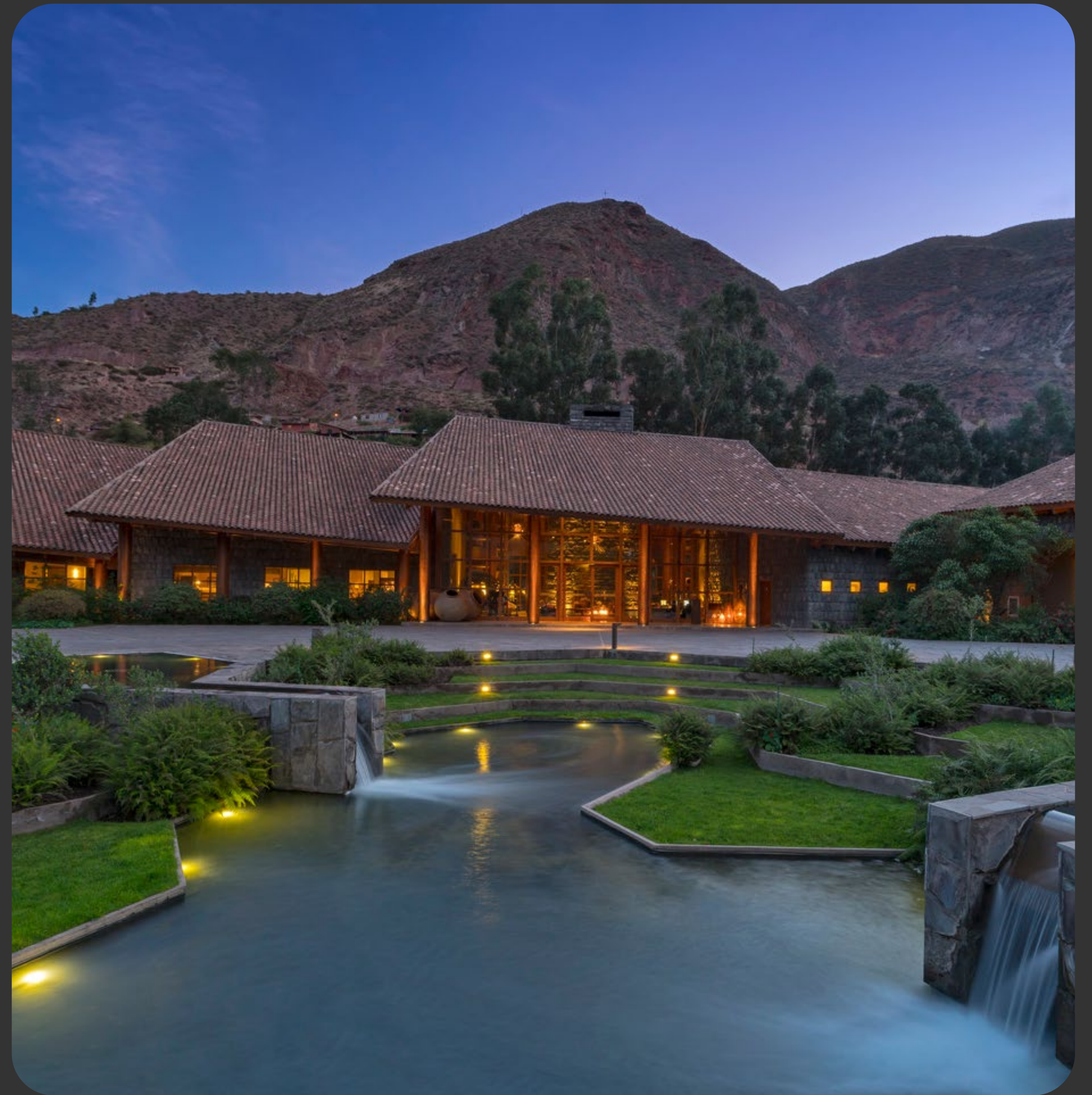
Tambo del Inka, a Luxury Collection Resort & Spa. Valle Sagrado.